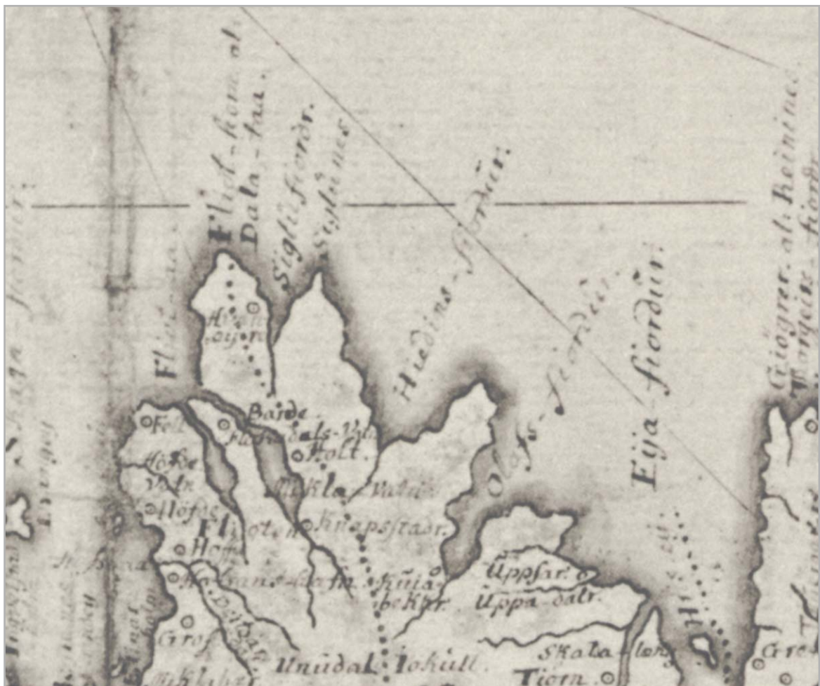
Ljósrit af korti af svæðinu frá árinu 1771.