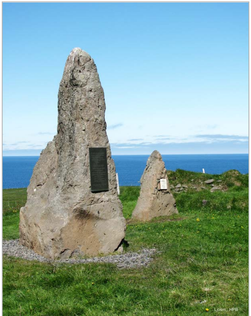
Minnisvarði um mannskaðann á Engidal

Löngum hefir þetta fagra býli í auðn verið á síðari öldum, einkum 14. 15. og 16. öld, einnig fyrri hlut síðustu aldar og nú um sinn. Féll snjóflóð á bæinn 12. apr. 1919, braut hann og létust þar 7 menn, var þó slík hætta hér aldrei áður kunn. Hann var þá byggður nokkuð neðar en fór brátt í auðn og brann síðan. Loks hefir nú viti verið reistur austast á undirlendi þessu og bær þar nærri svo byggt er nú landið þó í auðn sé hin forna byggð. Margt mun hér verið hafa örnefna, en flest mun glatað, það fornt var og merkast, fyrir hina löngu auðn og mun svo um öll býli Úlfsdala. Jafnvel hin forn-kunna: Dalatá (4) er nú ókunn og að mestu gleymd, mun hún þar vera er um síðir nefndist Lambanes en loks Sauðanes. Er því “Sauðanesviti” er þar stendur rétt nefndur: Dalatáarviti (5).