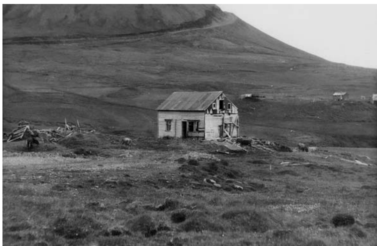
Dalabær kominn í eyði