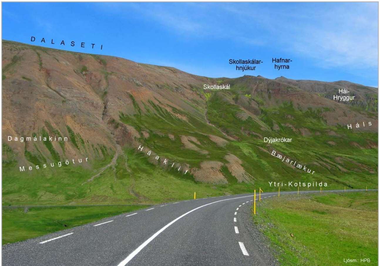
Dalabæjarland og Lækir

á Lambhaga er það byggðist. Nokkuð austar á bökkunum eru tóftir nokkrar og undir þeim byggðarúst mikil og há, hefir þar nefnst lengi: Vörðhús (28) af hverju sem það nafn er komið, út frá því vogur lítill: Vörðhúsbás (29) en fram þaðan all djúpt