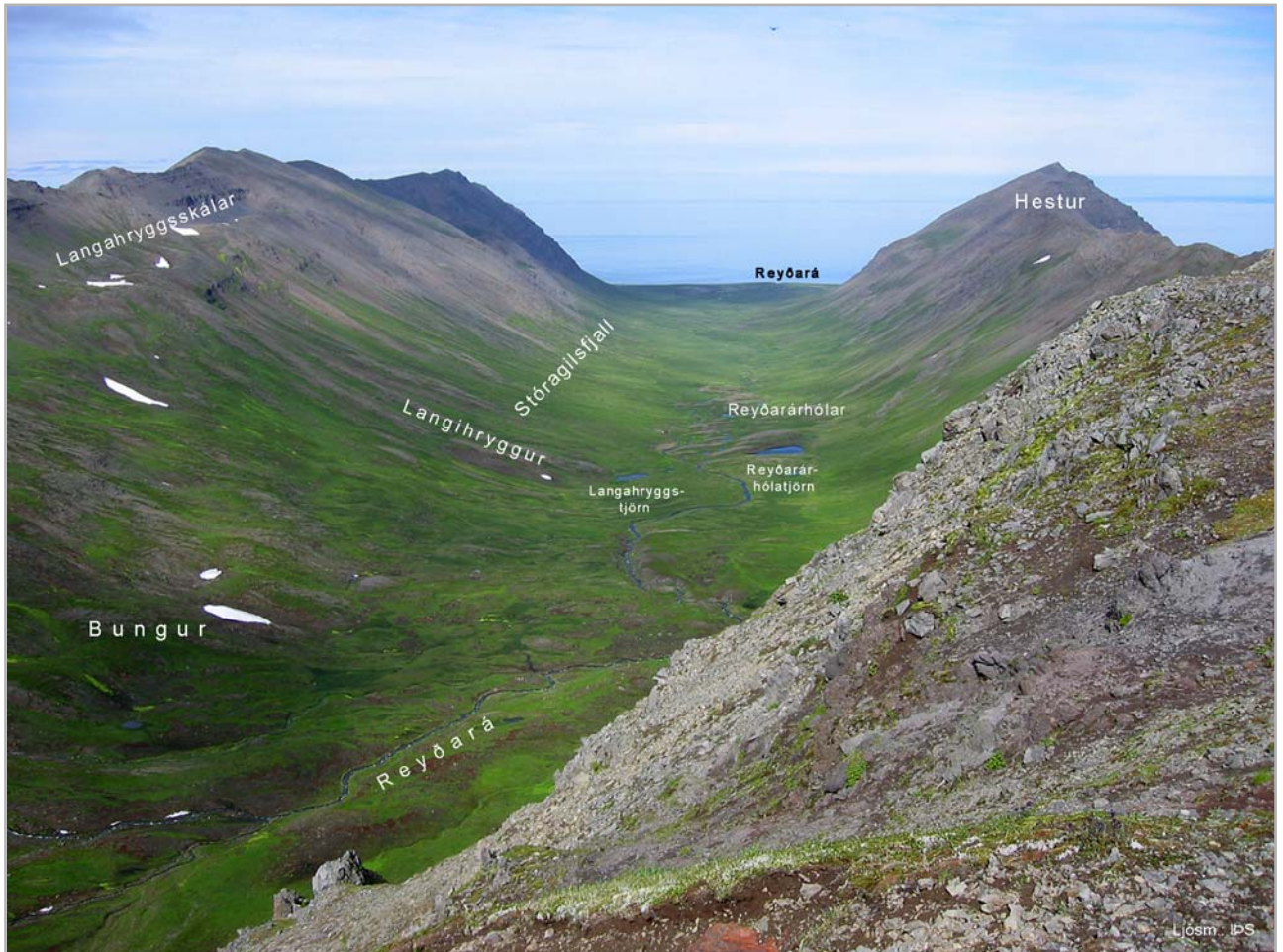
Horft til norðurs um Nesdal

Það er eitt hinna fornu býla, hefur staðið austan við enda Siglunessmúla undan gjá þeirri er að nokkru skilur Siglunessnúp frá Múlanum og átt vesturhlut dalsins til sjávar, sem Reyðará hinn eystri. Það hefir snemma komist undir Sigluness og í auðn líklega þegar á 14. öld. Hefur aurskrið úr gjánni síðar hulið meirihlut túns og mannvirkja, en forn garður sést neðan þess mjög mikill; hefir tún verið slétt og byggðarstæði fagurt. En nafn þess nú gleymt þó Gnúpur sé hér nefnt og glötuð öll örnefni er á það minna.