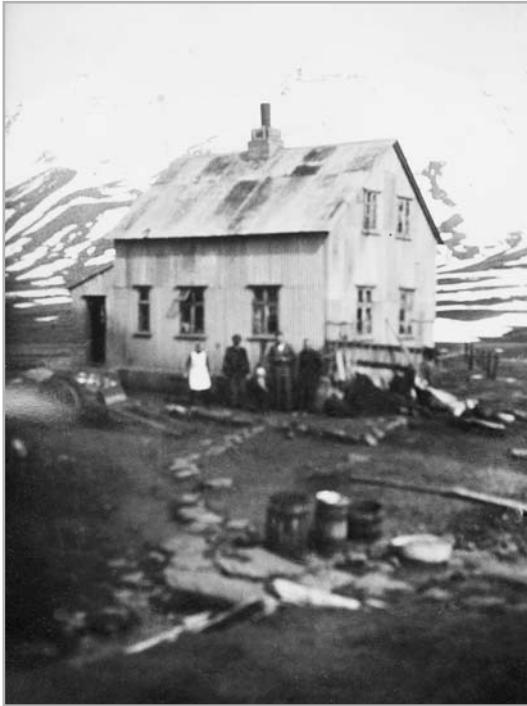
Gamli bærinn í Skarðsdal

Sá bær er framan við mynni dals þess er vestur gengur í hálendið yst úr Siglufjarðardal; skilur hann Siglufjarðar- og Úlfsdalafjöll er þó ná saman fyrir botni hans með hrygg mjóum. Yfir hann er hin helsta þjóðleið til Siglufjarðar (úr Fljótum) um skarð það er því nefnist Siglufjarðarskarð (1), dalurinn Skarðsdalur (2) og bærinn eftir honum. Stóð hann suður við á þá er nefnst mun hafa Skarðsdalsá (3) þó Leyningsá (4) kallist nú. Er hún aðalá dalsins og fellur syðst fram úr mynni hans, en önnur utar. Ganga hæðir nokkrar fram úr dalnum milli þeirra er nefnast Skarðsdalshryggir (5). Var byggðin suðaustan hæðanna og stóð ekki hátt; mun hún frá elstu tíð og sér þar nokkuð til fornra garða um tún meðalstórt, gott og grösugt. Lönd hefir býli þetta átt utan hinnar syðri ár, þar með mestan hlut Skarðsdals og nokkuð