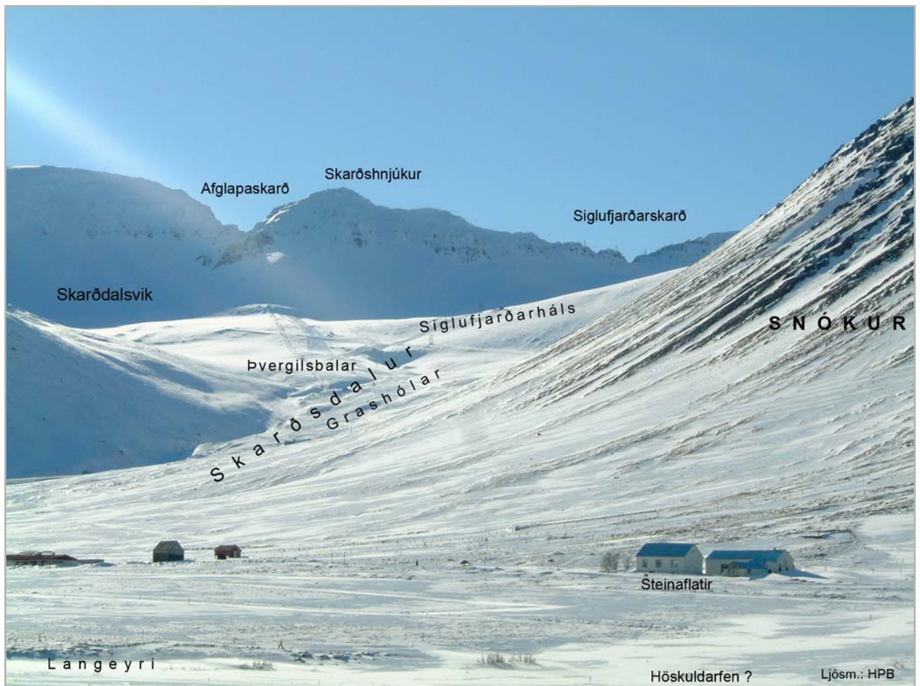
Sól og snjór í Skarðsdal

voru hér fluttar svo lengi, að vel muna það miðaldra menn. Nokkuð út frá skarðinu er á hinum hækkandi fjallhrygg lítið skarð, nefnt Steindyr (68). Nokkuð utar hæsti tindur Úlfsdalafjalla, Illviðrahnjúkur (69), og suðaustan hans urðarhvolf nokkur, Illviðraskálar (70).