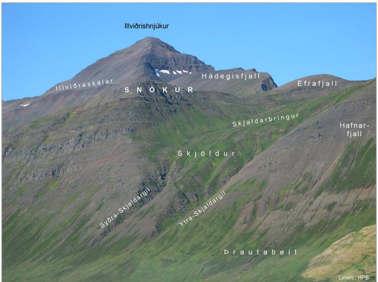
Snókur og Skjöldur

Haraldarholt (30). Hafði Haraldur nokkur þar búskap um sinn.