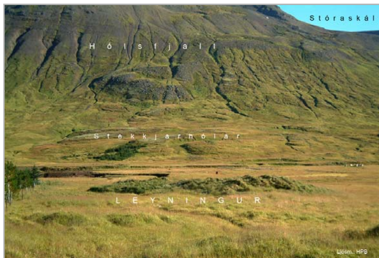
Tóftir af Leyningsbænum

Tún hefir hér ekki verið stórt en einkar gott og fagurt, en undirlendi mikið, allt hið fegursta engi samfelt. Lönd hefir Nes átt öll innan Skarðdalsár að löndum Hlíðar; þar með suðurhlíð Skarðsdals. Nokkrar fornar sauðaréttir voru hér inn frá túni, einnig ein innan við garðinn og hin yngsta við yngri rústir bæjarins, hafa þær þangað flust þá í auðn lá. Voru fornmenjar því í mesta lagi alls 50 – 60 tóftir, en var nýlega allt niðurbrotið. Átti hér garðrækt að hefja en varð aldrei. Lönd þessa býlis, ásamt Hlíðar, munu hafa lagst undir býlið Skarðsdal um sinn, lágu þar og fast að túni. Árin 1473 og 1488 er jörðin Skarðsdalur seld og fylgir þar með “kotið Leyningur ” (2). Það býli, sem þá hefur ungt verið, stóð norðvestur frá Nesi, á landi þess, fast út við Skarðsdalsá, gegnt Skarðsdalsbæ, er þá stóð á norðurbakka hennar. Nafnið er eðlilegt því lágt stóð byggðin og upp við hlíð, en hvarf er þar mikið upp með ánni, sakir hæða þeirra er fram ganga úr mynni Skarðsdals norðan með ánni þvert í aðaldalinn. Síðan var Leyningur lengi sjálfstætt býli, víst 3 aldir og naut landa Ness og Hlíðar. Var tún þar gott, mikil samfeldt engi og býlið hið ágætasta. Það varð eign kaupstaðarins 19... og fór þá bráðlega í auðn og rústir.