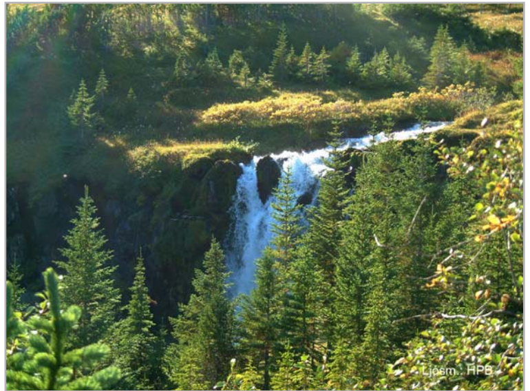
Leyningsfoss - einnig nefndur Kotafoss

Þar upp af eru melhöfðar nokkuð brattir en nú grónir því á þeim hafa fjárhús verið á síðustu öldum nefnist hinn syðsti Syðsta-Gerði (11) þá hinn næsti er lítið nær hærra: Efsta-Gerði (12) og út og niður af honum: Ysta-Gerði (13) en austan í þeim Gerðabrekka (14). Á Syðsta-Gerði var húsmannsbýli reist um 1891 nefnt Háagerði