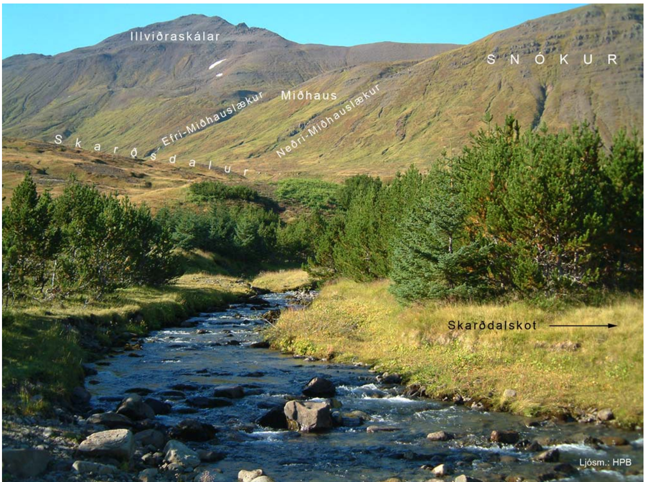
Skarðsdalsá (Leyningsá) og Skarðsdalur