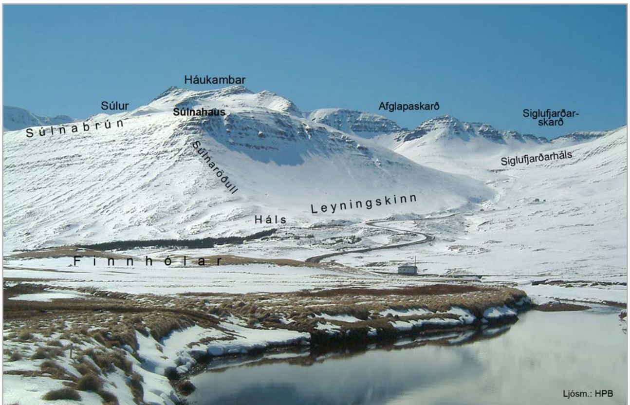
Súlur og Skarðsdalur