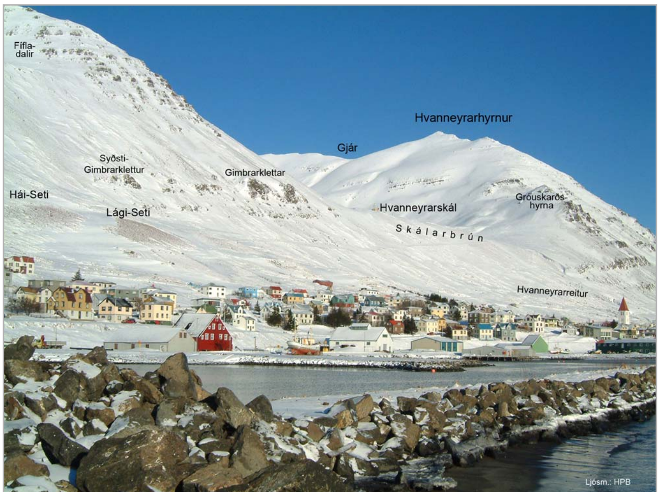
Horft frá Innri-höfn

er hæst sést að norðan, eru daladrög nokkur er suður liggja og úr hallar vatni í Strengsgilin og Hafnarlæk, er að nokkru kemur úr ytra gilinu, nefnast þau Leirdalir (27) og hæðirnar austan þeirra Leirdalabrúnir (28). Vestan Leirdala er aðal hryggur fjallsins og nokkuð hærri en eystri brúnirnar; en lægð er í hann nokkur, vestur frá Streng. Hefur hér verið tíðfarin gangleið þvert yfir Hafnarfjall í botn Úlfsdals hins meiri og oftast gengið upp Streng og vestur um lægð þessa; nefndist þetta því Strengsleið (29) og lægðin Strengsleiðarskarð (30). Ekki er leið þessi hestfær talin, sem hin áður nefnda Dalaleið, enda brekka meiri að austan; en beinni og fljótfarnari léttgengum mönnum.