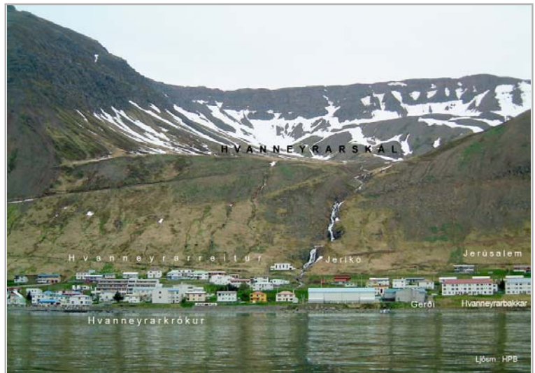
Hvanneyraráin var virkjuð 1913