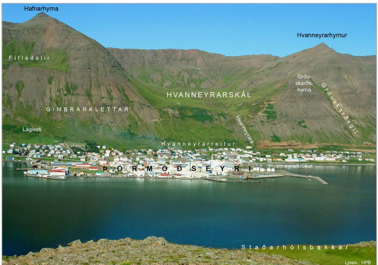
Þormóðseyri og Hvanneyrarskál

Sá bær hefir verið hið fjórða og ysta fornbýli vestan Siglufjarðar, en skammt milli þeirra allra. Stendur hann út og upp frá Þormóðseyri, sem mjög mun hafa eyðst að norðan þegar í ómuna tíð, og einnig að síðustu, fyrir grjótnám og fleiri vanhyggju manna. Bæjarstæði er hér gott, á melhöfða einum niður frá hlíð fjallsins. Hefir tún verið allstórt, en fremur óslétt. Sjást nú litlar leifar fornra garða utan og ofan þess er mjög hafa varið það vatnságangi er síðar hefir spilt því. Sunnan þess voru tveir fornir garðar og hinn yngri sunnan allstórrar flæðigrundar sem fyrst hefir verið sunnan túns. Má helst ætla að það sé Hvanneyri (2) sú er nafnið er af komið eða túnið allt sunnan bæjar. Hefir lækur sá er nú fellur norðan bæjarins, nefndur: Hvanneyrará (3) myndað grundir þessar í fornri tíð og þá fallið suður allt í ós Álalækjar, en einnig oft hér þvert niður í lón mikið yst á láglandinu og fyllt það að nokkru, nefnist það: Hvanneyrartjörn (4) sjást glöggf fornir farvegir árinna, einnig hið forna tún ofan og sunnan bæjar. Er líklegt að hvanngróður hafi mikill verið í dalhvolfi því er vestur gengur í fjöllin nær miðhlíðis upp frá bæ og nefnist Hvanneyrarskál (5) og hafi áin, er þaðan kemur, borið hann á láglandið. Haglönd eru hér allgóð efra og út um hlíð og