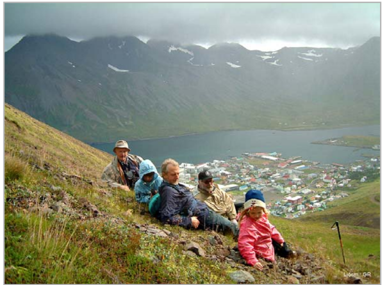
Á leið upp í Gróuskarð

strönd, en engi var gott sunnan bæjar og nokkur ytra; rekar miklir og útræði gott. Var jörð þessi hér með þeim bestu talin. Hér var þingstaður á 18. og 19. öld, fluttur frá Siglunesi; en prestssetur og aðalkirkja frá 1614 einnig þaðan flutt. Bænhús og grafreitur var hér áður. Búnaður hefir hér nokkur haldist til síðustu ára. En svo hefir byggð kaupstaðarins nú gengið á þetta forna býli, að brotið er engið, og túnið mjög, þó sist hafi þess þörf verið; mun því skammt þess að bíða að flest verði hér glatað, menja og minninga, utan örnefni einhver er á byggð þessa mættu nokkuð minna.