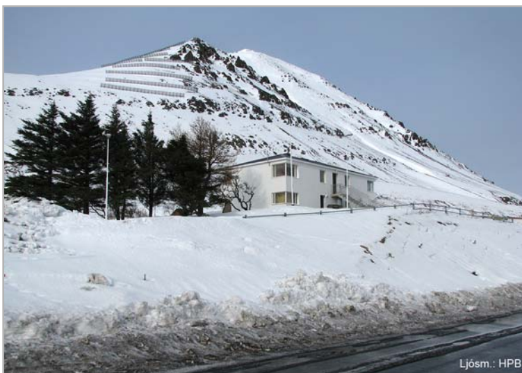
Prestssetrið Hvanneyri á Hvanneyrarhóli

Nefnast hátindar fjallsins (tveir saman) norðan Hvanneyrarskálar: Hvanneyrarhyrnur (6) en nær og neðar í hlíðarröðlinum Gróuskarð (7) og Gróuskarðshyrna (8). Hlíðin suður og upp frá bæ, milli árinna og suðurmerkja: Hvanneyrarreitur (9) og takmarkast hann að ofan af neðri brún Skálarinnar og klettabríkum tveimur suður frá henni eru það Ysti Gimbrarklettur (10) og Mið Gimbrarklettur (11) er áður getur; en niður frá reitnum að Álalæk var hið fagra: Hvanneyrarenghi (12). Þá nefnist undirlendið allt út frá túni: Hvanneyrarströnd (13) en bakkarnir neðan þess og túnsins út frá á: Hvanneyrarbakkar (14) einnig víkin niður frá bæ: Hvanneyrarkrókur (15) og malarkambur breiður sunnan hennar: Hvanneyrarmöl (16) náði kambur sá umhverfis láglandið norðan og austan; en innan hans hefir norðurhluti þess aðeins verið lón mikil (tvö) og forir, utan sandrif fornt er