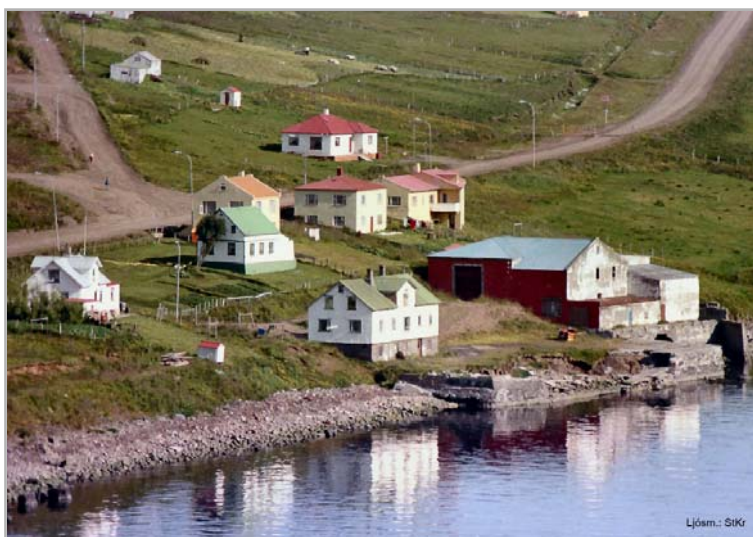
Húsin í Bakka böðuð í morgunsól 1980