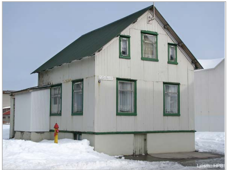
Eyrargata 4 - Eyri

Nokkur voru hjábýli reist í landi Hvanneyrar hina síðustu öld og fyrst þeirra býlið: Lækjarbakki (31) sést það í manntalsskrá 1813 en hvar það stóð er ekki fullvíst; varð sá úti það ár, er þar bjó og hefir það brátt í eyði farið. Þá var býlið Hvanneyrarkot (32) byggt um 1831 syðst á enda Grandans, þar hann mætir eyrinni, niður frá Álalæk; stendur það enn og nú skásett norðan við ytri húsaröð Eyrargötu og telst þar Lækjarg. 15. Þá býlið Hvanneyrarbakki (33) byggt um 1866 yst í jaðri