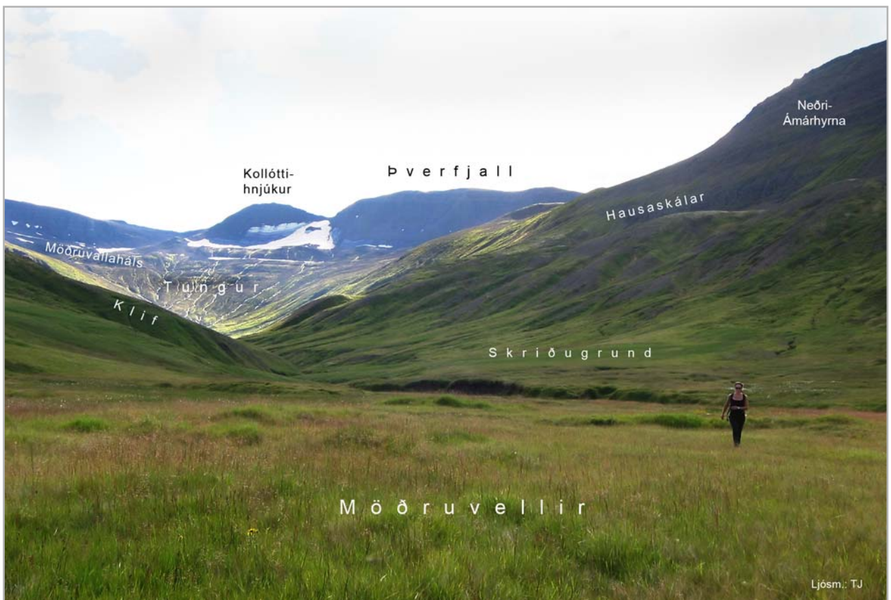
Á gangi í landi Möðruvalla

Alllangt upp sunnan Grundarár, er allmikill hóll er nefnist: Stórhóll (37). Er hann yst á Möðruvallabrúnum, en þær eru þvert um hlíðina milli Illagils og Grundarár. Niður frá þeim í hlíðinni eru gil nokkur og milli þeirra hryggir, nefnist það svæði, utan Illagils: Hryggir (38). Nokkuð upp frá Stórhól og nokkuð fjær Grundará er: Efri-Hóll (39). Þaðan er ekki langt upp í Möðruvallaskál; en fyrir mynni hennar gengur melröðull út frá Möðruvallahnjúk, nefndur: Pröskuldur (40). Upp um Möðruvallaskál og yfir háfjallið, um skarð eitt lítið austan hennar, er kunn gangleið til Ólafsfjarðar. Er hún kennd við Fossabrekkur, sem er kunnugt örnefni austan fjallsins. Norðan í Möðruvallahnjúk, niður í Möðruvallaskál eru gildrög þrjú er um má fara, nefnast þau Austurgjá (41), Miðgjá (42) og Vesturgjá (43). Suður frá Möðruvallabrúnum, milli Illagils og Stóralækjar nefnist: Ytri-Bæjarbrún (44). Nokkuð niður frá henni, en út og upp frá túni nefnist: Klettabelti (45) gengur skriða niður frá því, allt ofan á Stóru-Lækjargrund utan túnsins. Upp frá Ytri-Bæjarbrún er melhöfði allstór nefndur: Högg (46). En upp frá því er Möðruvallafell áður nefnt, niður frá Möðruvallahnjúk. Sunnan Stóralækjar, beint suður frá Ytri-Bæjarbrún, er Syðri-Bæjarbrún (47). Ofan hennar er Bæjarskál (48). Upp frá henni Bæjarstallur (49).