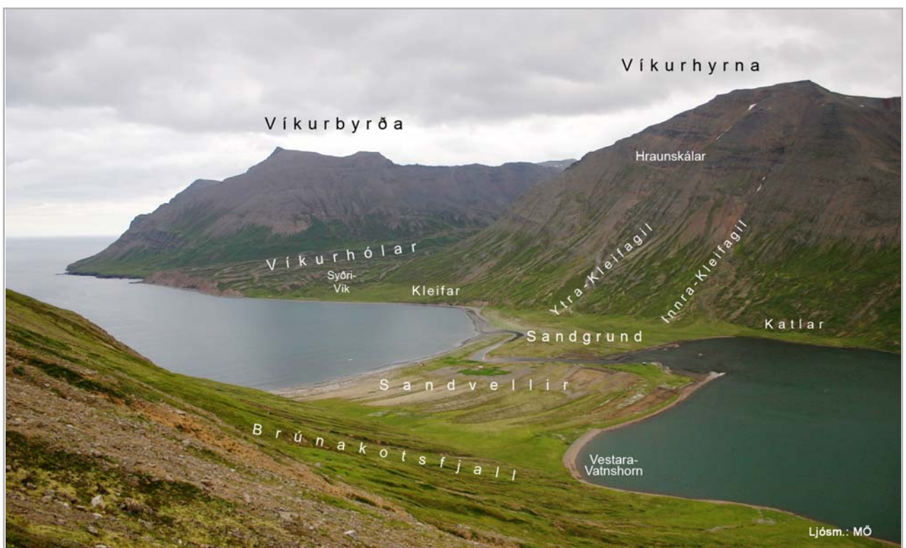
Útsýni yfir Víkurland að austanverðu

Löndin austan fjarðar hefir Vík fengið þá hún varð býli, og flestar nýttjar þessara landa þá hér varð auðn. Þá var þó annað býli reist vestan vatnsins er taldist 1/3. móti Vík. Naut það vesturhlíðanna meðan það stóð, en Vatnsendi þó innsta hluta þeirra og Vík þar engja fram á 18. öld, uns allt lagðist þetta til Víkur. Var hún þá lengi ein byggð. Enda þótt vel færi býli þessu nafnið Héðinsfjörður er út við hann hefir eitt staðið og átt þar allar nýttjar, hefir samnefni þess við hann því valdið, hvað fljótt gleymdist nafn