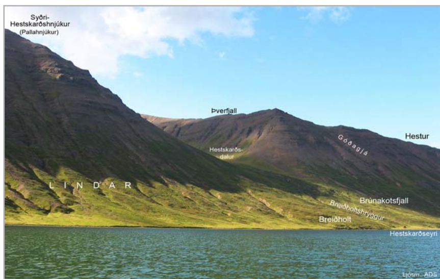
Lindar og Breiðholt

Inn frá Hestskarðsdal er fjallshnjúkur hár, innan hans skál allstór, austan í fjallinu, inn frá henni önnur minni skál, ofarlega og innan hennar einnig hár hnjúkur. Nefnast skálar þessar: Ytri-Fýluskál (34) og Syðri-Fýluskál (35) en hnjúkarnir: Ytri-Fýluskálarhnjúkur (36) og