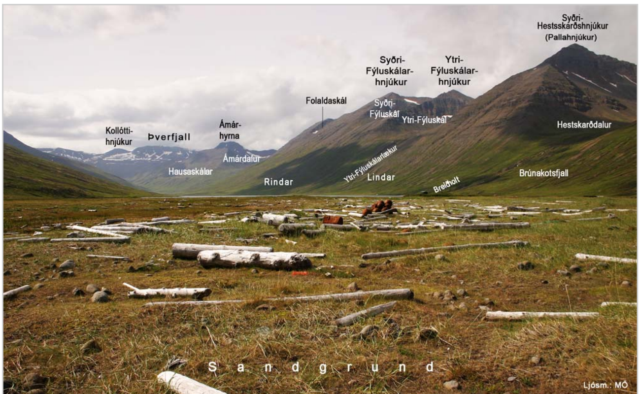
Sandgrund og fjöll í bakgrunni

Sá bær má ætla að hér hafi mestur verið og lengi kunnastur þó nú sé gleymdur og hér öllum ókunnur. Hefir hann staðið fyrir botni fjarðarins, utan hins mikla stöðuvatns sem þar liggur næst inn frá og út að hlíðum tveim megin. Er þar eiði eitt á milli af sandöldum, fornum, sléttum og vallgrónum og byggðarstæði því gott og fagurt. Má nær víst telja að hér hafi verið reist hin fyrsta byggð fjarðarins og lengst hefir hér byggð varað, er á aldir leið og í auðn tók að falla, er þessa býlis hér oft eins getið á 14. 15. og 16. öld, og þó stundum í eyði. Hefir bær þessi staðið inn við vatnið og fast vestan við ósinn þar úr því fellur, sést þar enn byggðarúst allhá og mikil og grjótlög nokkur utar á berum sandi, því mjög hefir hér blásið upp hið næsta og besta túnsins og byggð þessi því að lokum eyðst að fullu, líklega um lok 16. aldar.