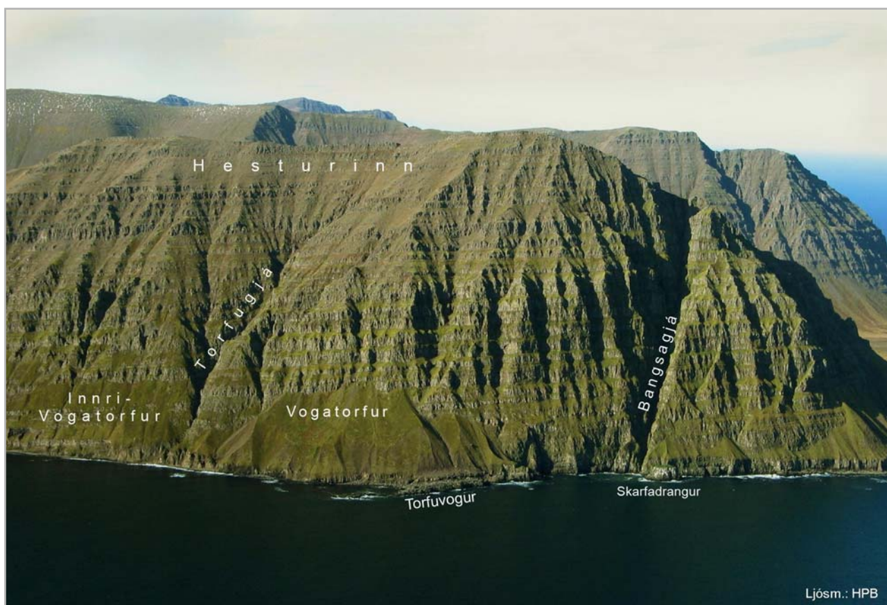
Hesturinn - norðurhluti

Selsteinn (53). Litlu utar eru skörð tvö í háhrygg fjallsins, nefnd: Pútuskörð (54) er út og upp til þeirra einnig kunn gangleið yfir í Reyðarárdal. Allt niður frá skörðunum eru tvö gil, nefnd: Innri-Pútuskarðagjá (55) og Ytri-Pútuskarðagjá (56). Út frá þeim undir bökkunum eru vogar nokkrir nefndir: Bæjarvogar (57) nefnast þeir í sóknarlýsing 1840 “Innidrápsvogar”. Þar hafa og síðar verið selalagnir nálægt, en aldrei innidráp og nú hvorugt. Upp frá vogunum eru grasflesjur nokkrar, neðst í hlíðinni, nefndar: Innri-Bæjartorfur (58) og út frá þeim Ytri-Bæjartorfur (59) skilur þær gilrauf er allt gengur ofan af háfjalli. Er þar grunnt skarð í hrygg fjallsins, nefnt: Breiðaskarð (60) og gilið Breiðaskarðsgjá (61). Skammt utar, upp um ytri torfurnar, gengur önnur gjá, styttri, nefnd: Uppgöngugjá (62) því upp á torfurnar verður helst um hana farið. Fram undan ytri torfunum eru klettabríkur nokkrar, nefndar: Strillur (63) og út frá þeim vík lítil, nefnd: Strilluvík (64). Út og upp frá henni eru og grastindar nokkrir nefndir: Spælar (65). Innan við þá, en utan torfanna er og gil ofan úr fjalli, nefnt: Spælagjá (66). Út frá Spælunum eru enn tvö gil, ofan úr háfjalli, og spölur nokkur á milli, nefnist hið innra og meira: Innri-Kapalgjá (67) hið ytra og minna: Ytri-Kapalgjá (68). En milli þeirra nefnist: Ófærastykki (69).