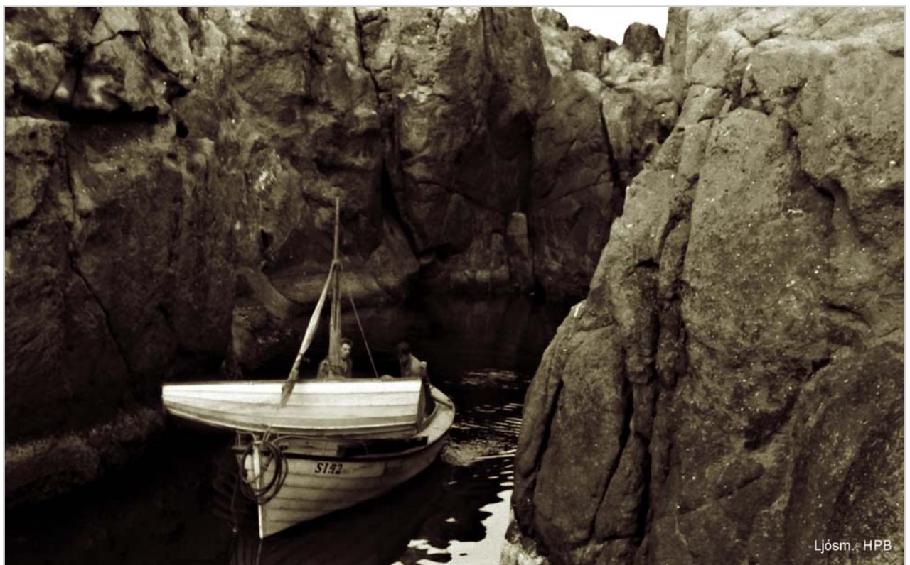
Á báti í Torfuvogi