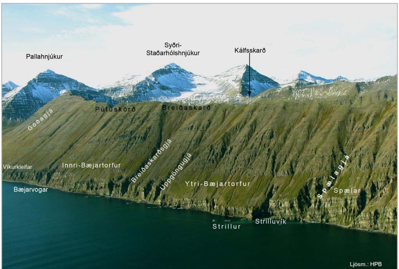
Hesturinn - suðurhluti

Vestan Héðinsfjarðar eru hlíðar mjög brattar, víðast með gróðurlitlum skriðum en neðan þeirra eru sæbrattir hamrabakkar allt inn fyrir horn fjarðarins nefnast innst í þeim, upp frá víkinni: Víkurkleifar (50). Framan í þeim er kindum hætt við að festast og nefnist þar: Festaklettur (51). Gildrag er þar og ofan úr háfjalli, utan við kleifarnar, nefnt: Kleifagil (52). Þar skammt utar, lítið frá landi, er stakur steinn, nefndur: