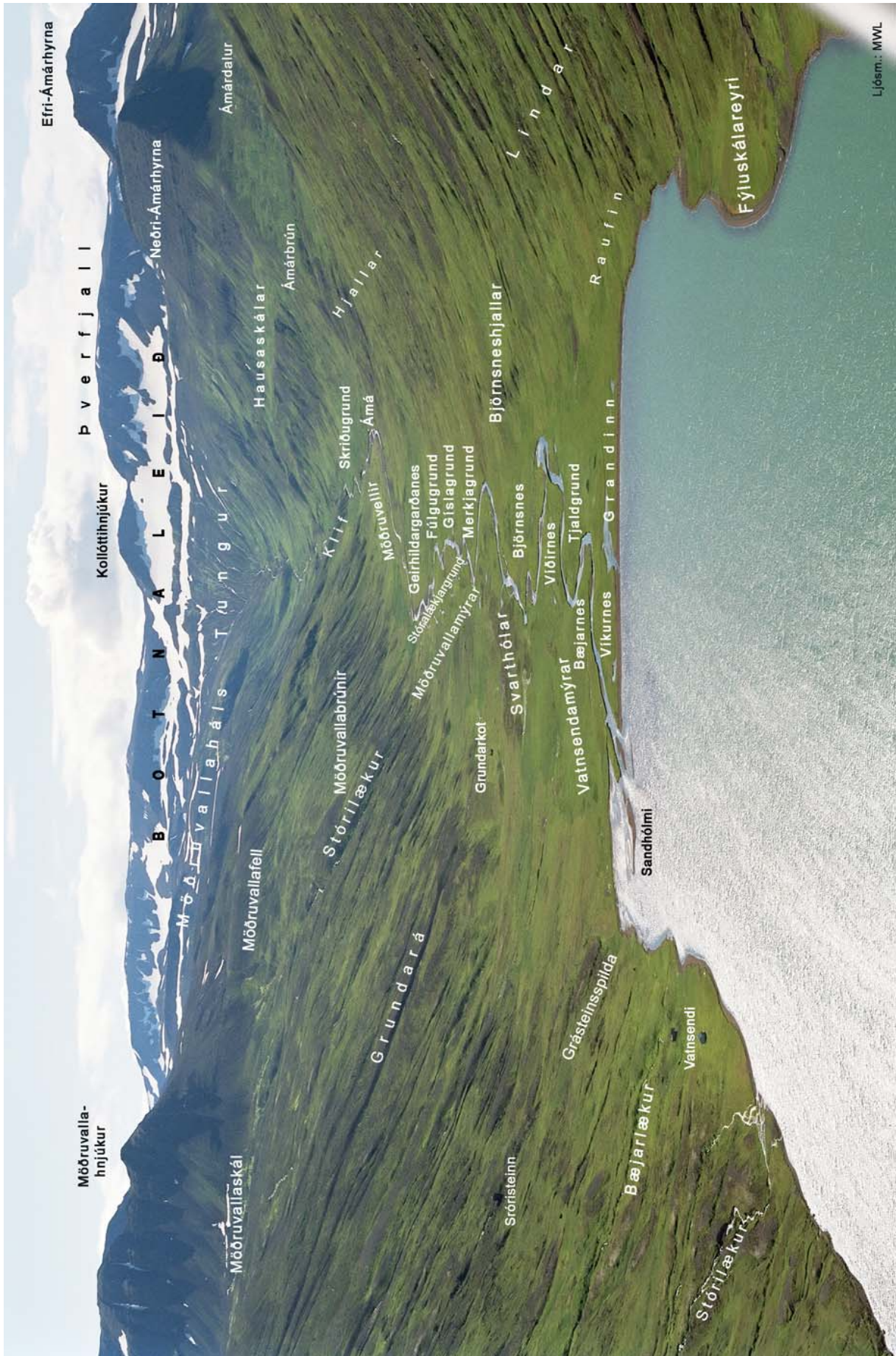
Örnefni fyrir botni Héðinsfjarðar