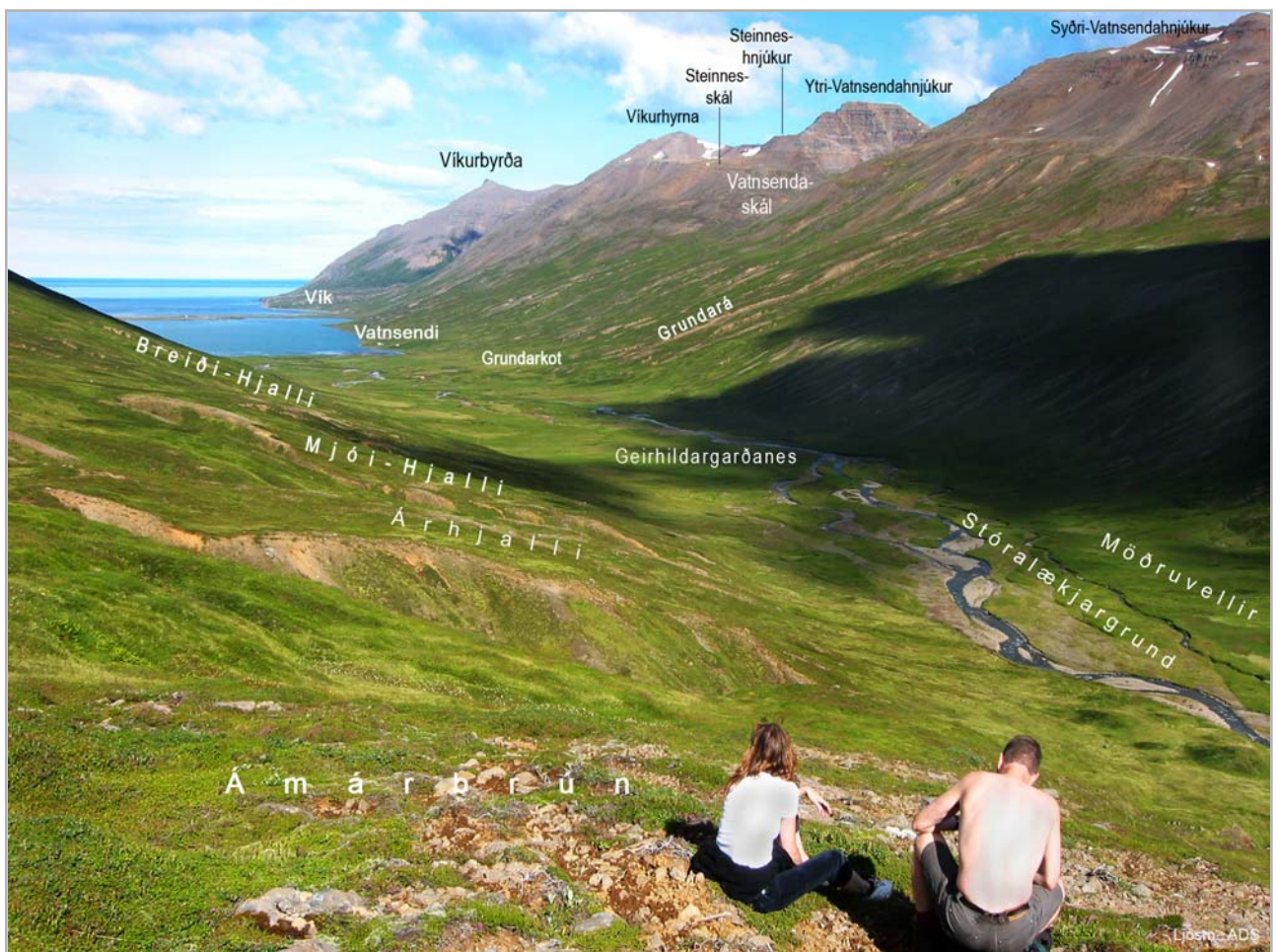
Útsýni af Ámárbrún

Upp í hlíðarhallanum niður og út frá Ystahjalla, er móareitur grænn, nefnast þar: