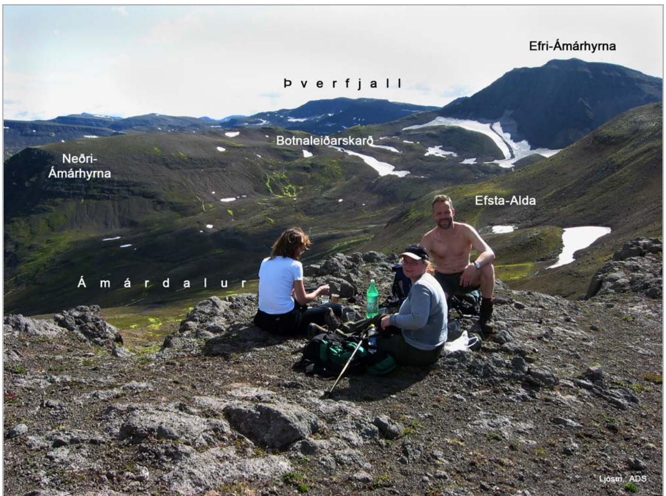
Áð á Hólsskarði

Upp og út frá Litlu-Skál, allmikið ofan Fremri-Hausa og allt út undir Neðri-Ámárhrynu, eru hæðastallar nokkrir nefndir: Fell (74). Um þetta svæði hefir alkunn leið verið sumar og vetur allt frá Ólafsfirði um Möðruvallaháls, og fyrir botn dalsins um Tungur og Fell ofan Neðri-Ámárhrynu vestur um Ámárdalsbotn að Hólsskarði, til Siglufjarðar; nefndist þetta: Botnaleið (75) og milli Efri- og Neðri-Ámárhryna: Botnaleiðarskarð (76). Inn fyrir botni Ámárdals, sem ofan til er grunnur og þar liggur mjög til suðurs, er fjallshryggur allbrattur en þunnur mjög. Liggur hann vestur frá Efri-Ámárhrynu og tengir hana þar við háfjöllin innan Siglufjarðardala. Á hrygg